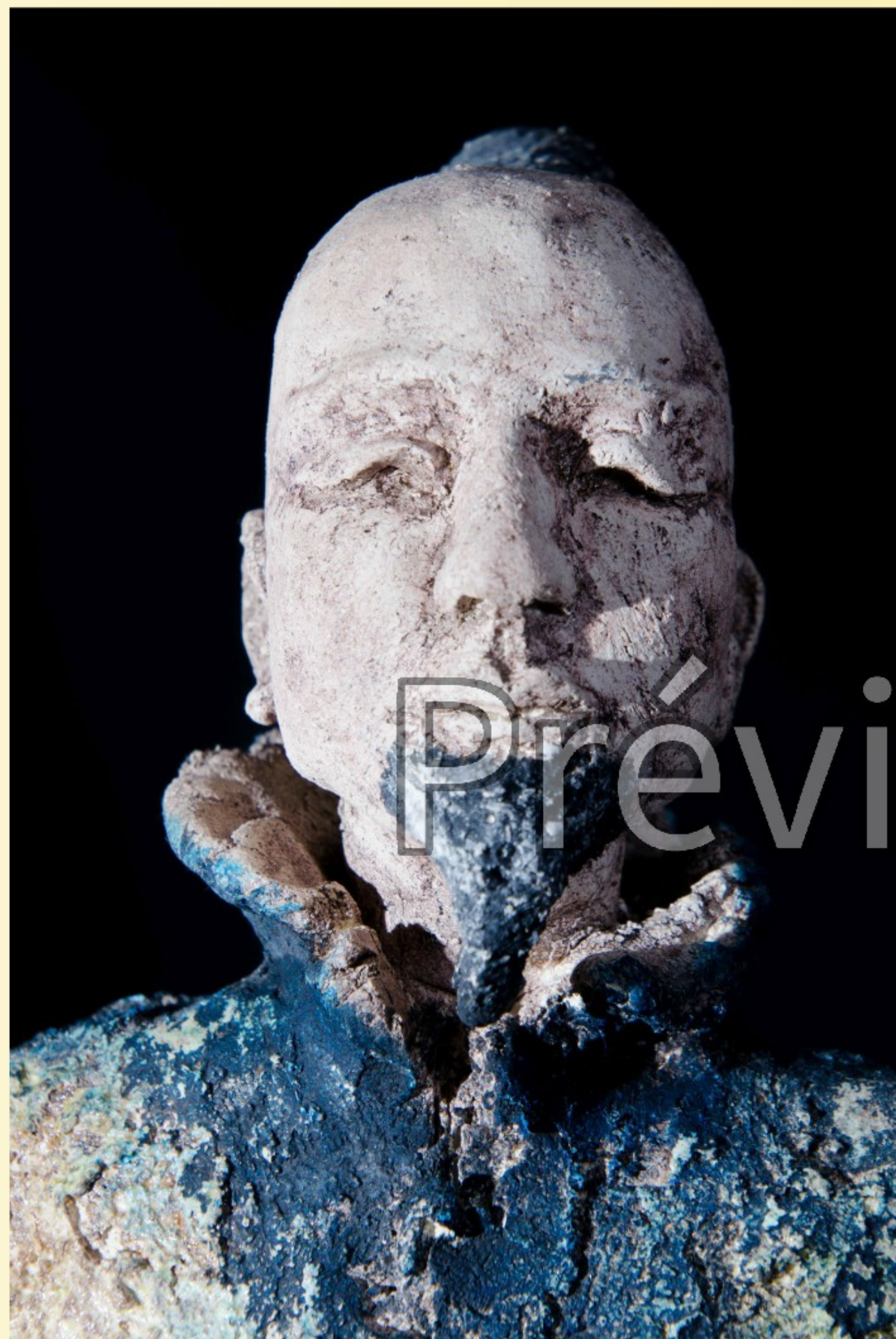
Guerrier au repos - 2017