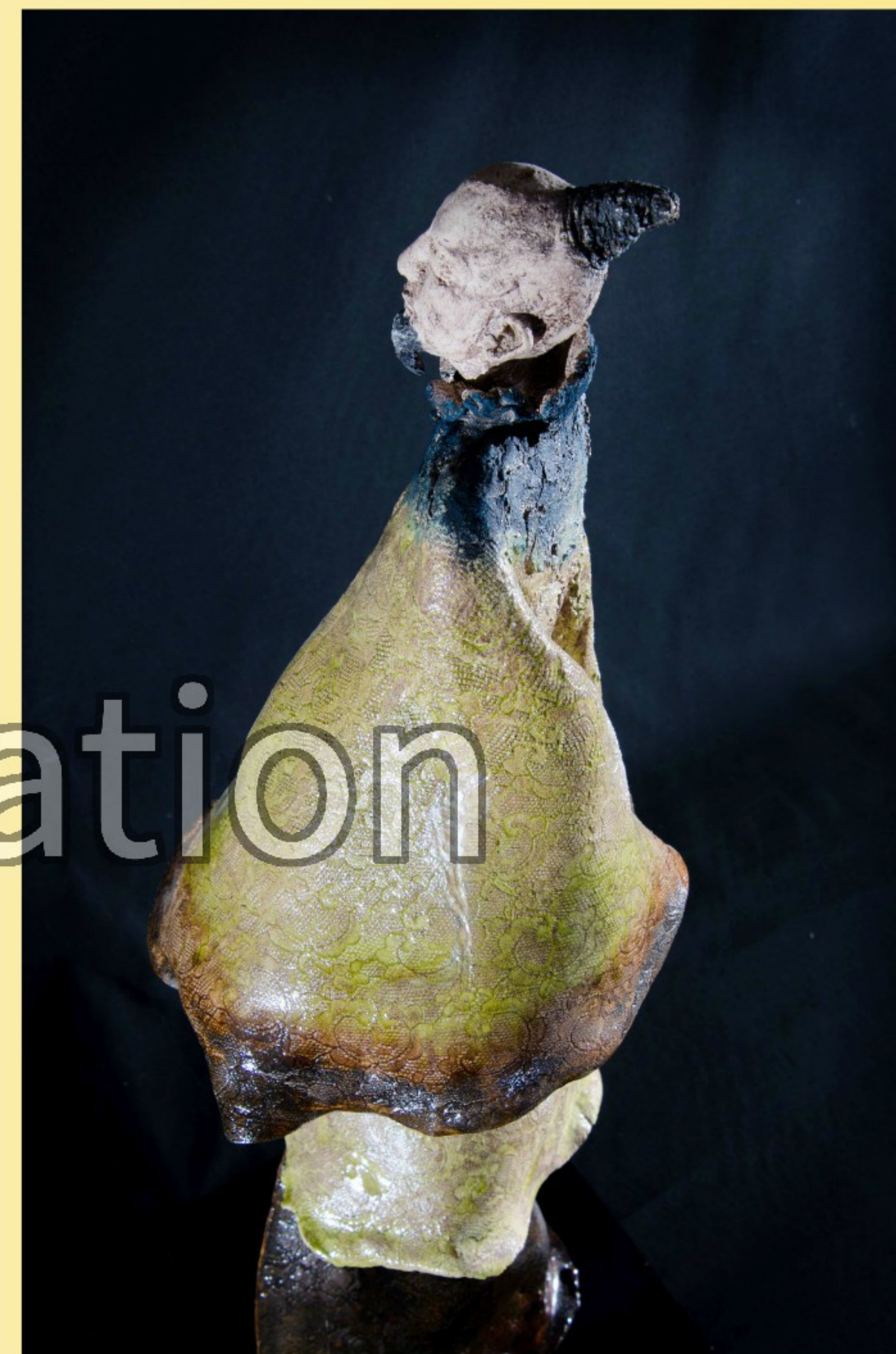
Au milieu de l'hiver, j'apprenais enfin qu'il y avait en moi un été invincible. Albert Camus